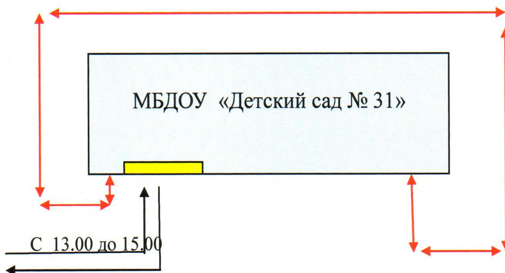
Схема № 2